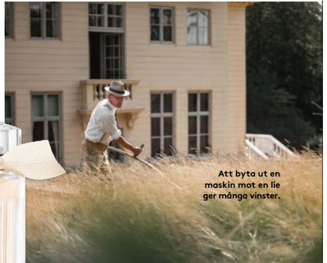
Att byta ut en maskin mot en lie ger många vinster.