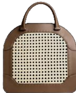
Läderväska med front av rotting, pris 5 595 kr, Palmgrens.

Kombinationen av läder och rotting har blivit Palmgrens signum. I samband med 125-årsjubileet i år lanseras nya produkter, bl a en rottingväska i fyra olika färger. Den säljs i en numererad och limiterad upplaga om totalt 100 väskor.