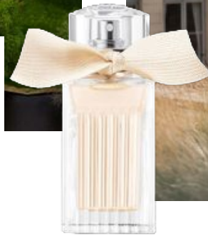
Chloé Mini Signature EdP, 20 ml, 425 kr.